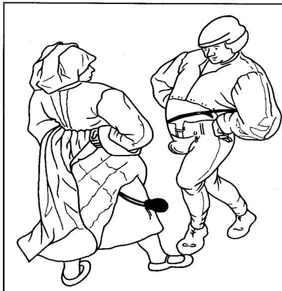
Pieter Brueghel II, détail Danse de Noce en plein air , 1607

Dans un deuxième temps, le groupe visite le Musée . C'est le même guide-animateur qui l'accueille afin d'assurer une continuité et une familiarité pour les participants.